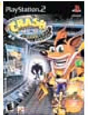
CRASH BANDICOOT: Hermanns favoritt.