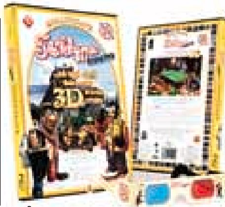
FLÅKLYPA GRAND PRIX: Emils favoritt.